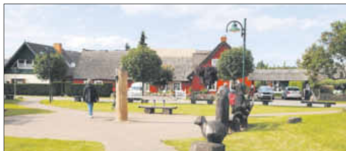
Der Dorfplatz im alten Zempiner Ortskern