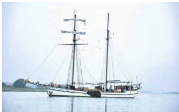
Die Weisse Düne auf dem Nepperminer See