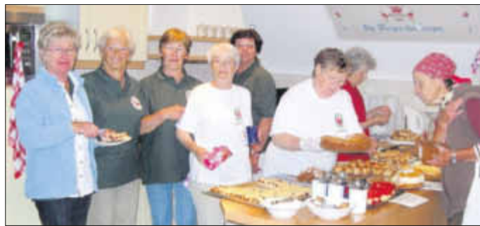
Die Damen der Ortsgruppe der Volkssolidarität hatten wieder einmal leckeren Kuchen gebacken.

zum 94. Geburtstag zum 90. Geburtstag zum 80. Geburtstag zum 76. Geburtstag zum 75. Geburtstag zum 72. Geburtstag zum 72. Geburtstag zum 71. Geburtstag zum 70. Geburtstag zum 70. Geburtstag zum 68. Geburtstag zum 67. Geburtstag zum 60. Geburtstag