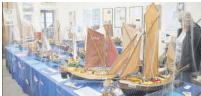
Die Ausstellung im Vereinshaus „Uns olle Schaul“