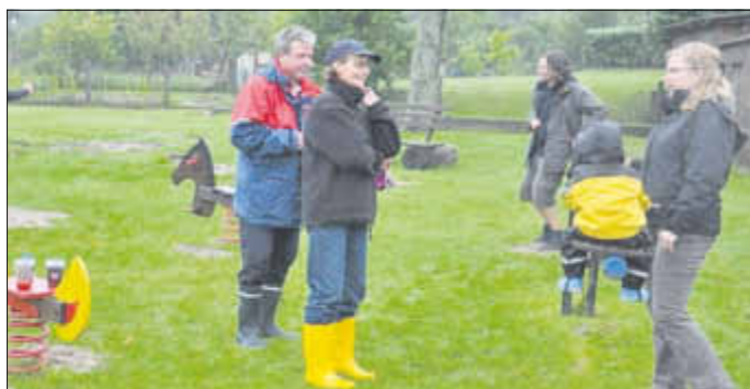
Jede Minute ohne Regen wurde genutzt, um draußen zu sein!