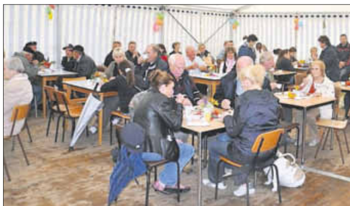
Volles Festzelt beim Kaffeekonzert und Genuss des selbstgebackenen Kuchens