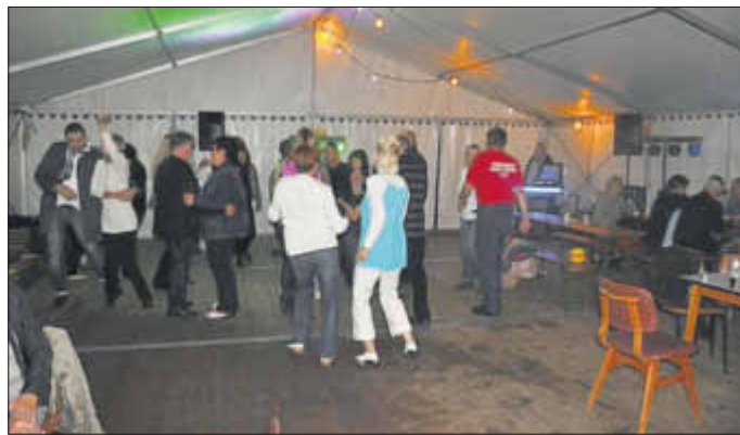
Das Tanzbein wurde kräftig geschwungen