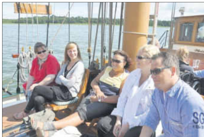
Die Sonne lacht und die Gäste auf der Weissen Düne auch.