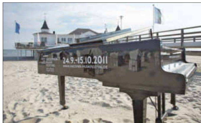
Foto: Flügel an der Seebrücke Ahlbeck

Seit 1994 widmet sich das Usedomer Musikfestival im Spätherbst dem Kulturraum rund um die Ostsee und stellte unter anderem schon die Kulturszenen Skandinaviens, des Baltikums und des ehemaligen Preußens vor. 2011 wird das Musikfestival volljährig und widmet sich in der 18. Saison dem baltischen Staat Litauen. Vom 24. September bis 15. Oktober empfängt die Sonneninsel Usedom die weltweit bekanntesten Vertreter litauischer Musik. Darunter unter anderem den Cellisten David Geringas (artist in residence) und die Sopranistin Violeta Urmana . Die litauische Sopranistin gilt als eine der führenden dramatischen Soprane ihrer Zeit. Sie ist auf den Opernbühnen der Welt zu Hause und fasziniert mit lupenreiner Technik und mit-