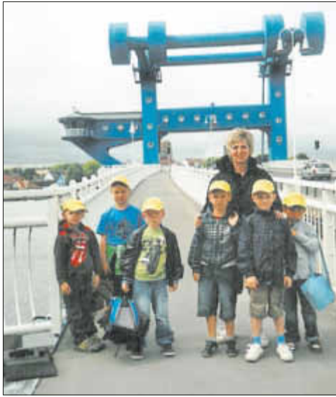
Besuch der Wolgaster Brücke