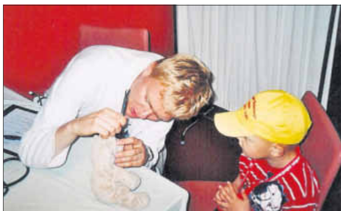
Beim „Teddydoktor“ in Wolgast