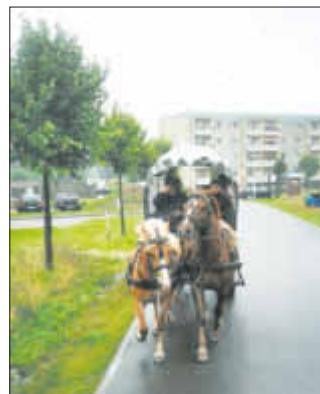
Mit der Kutsche geht es zum Bohrturm