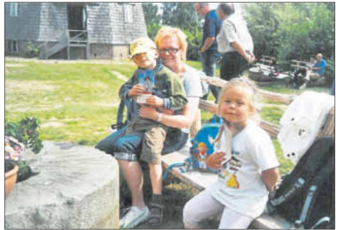
Wanderung nach Benz auf den Mühlenberg