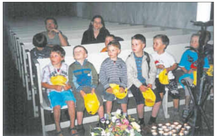
Wanderung nach Benz in die Kirche