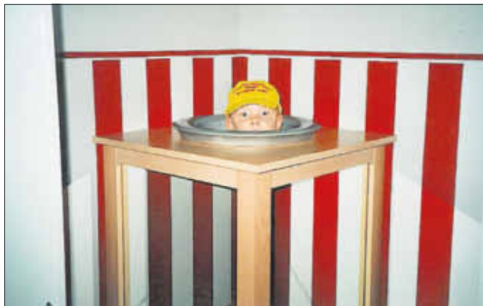
Exkursion zur „Phänomenta“ in Peenemünde