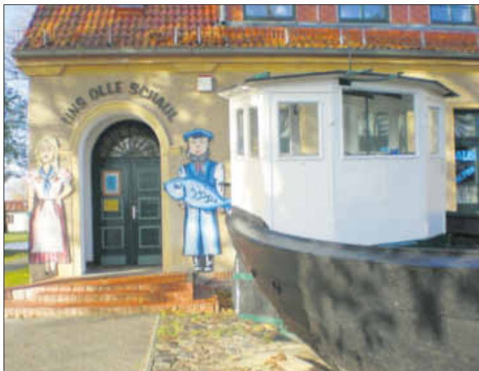
Eingangsbereich Vereinshaus „uns olle Schaul“