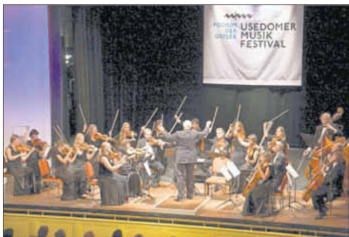
Eröffnungskonzert des Usedomer Musikfestivals mit dem St. Christopher Kammerorchester unter der Leitung David Geringas, im Kaiserbädtersaal in Heringsdorf.

Landkreises Ostvorpommern, der Ämter Usedom-Nord und Usedom-Süd, der Städte Wolgast und Winoujcie und den Gemeinden der Insel Usedom, beteiligte sich auch in diesem Jahr, die aus rund 80 Förderern der Region bestehende Unternehmensinitiative für das Usedomer Musikfestival an der Finanzierung der 18. Saison. Medienpartner sind NDR Kulturförderung in Mecklenburg-Vorpommern, NDR Kultur, Der Tagesspiegel und die Ostsee-Zeitung.