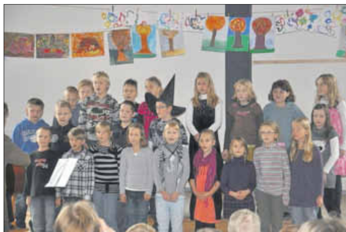
Die 3. Klasse begeisterte die Zuhörer mit ihrem Hexenlied