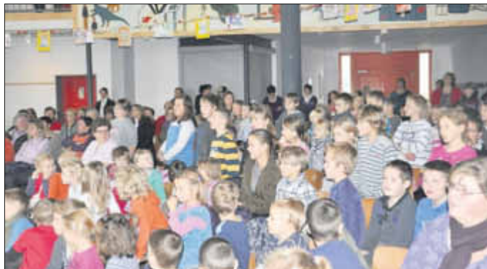
Die Kinder sind begeisterte Zuhörer ihrer Mitstreiter.