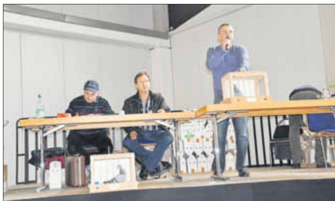
Das Versteigerungsteam konnte die teuerste Taube für 5.500 EUR an den Mann bringen.