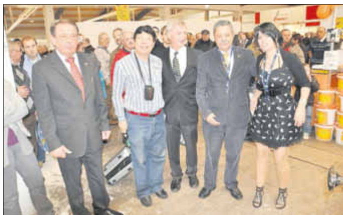
Zum Eröffnungsrundgang waren der Präsident des Taubenweltverbandes aus Portugal sowie ein Repräsentant aus China zugegen.