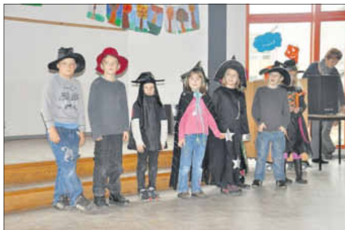
Schülerinnen und Schüler der 2. Klasse trugen das Hexengedicht vor.