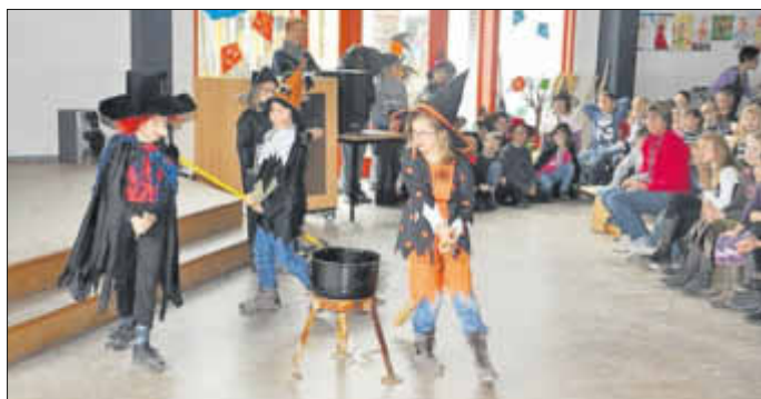
Der Hexentanz war ein Highlight an diesem Vormittag.