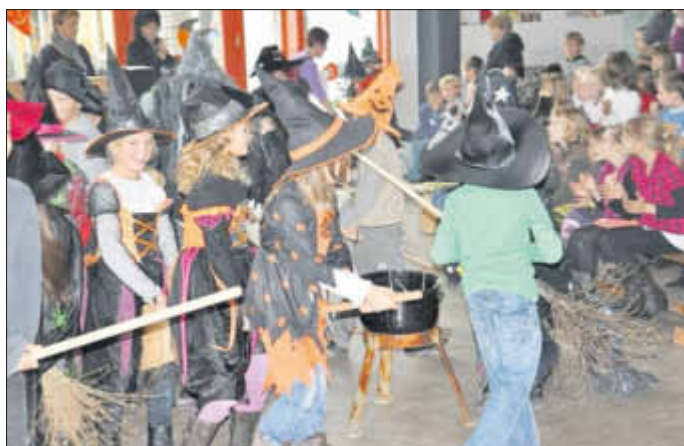
Das Verkleiden hat den Kindern besonders viel Spaß gemacht.