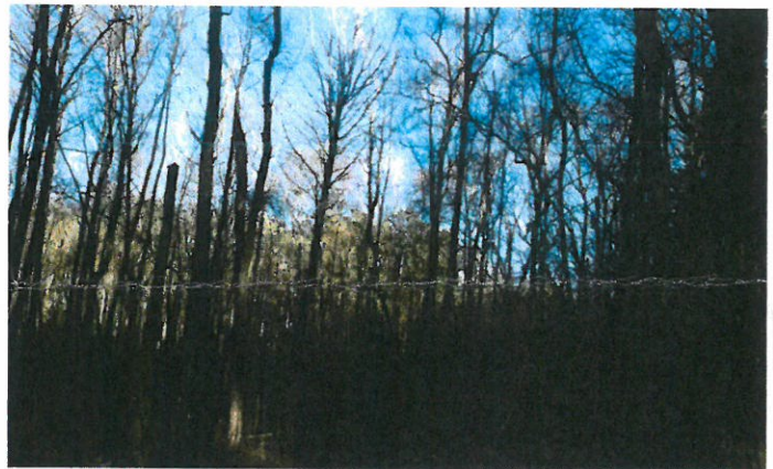
nördl. Teil, bestehend aus Birke, Eiche, Erle