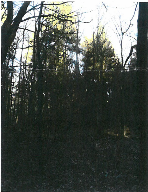
südl. Teil, v. a. aus Eiche, Douglasie, Fichte

Flurstück in Streulage, überwiegend mineralische Nasstandorte, Laubmischwald mittlerer bis geringer Qualität, im Alter zw. 70 und 100 Jahren, zahlreiche Mischbaumarten: Eiche, Douglasie, Fichte, Erle, Birke, Buche; Bestockungsgrad zw. 0,6 und 0,7; Einschränkungen in der Bewirtschaftung durch hohe, naturschutzrechtliche Relevanz.