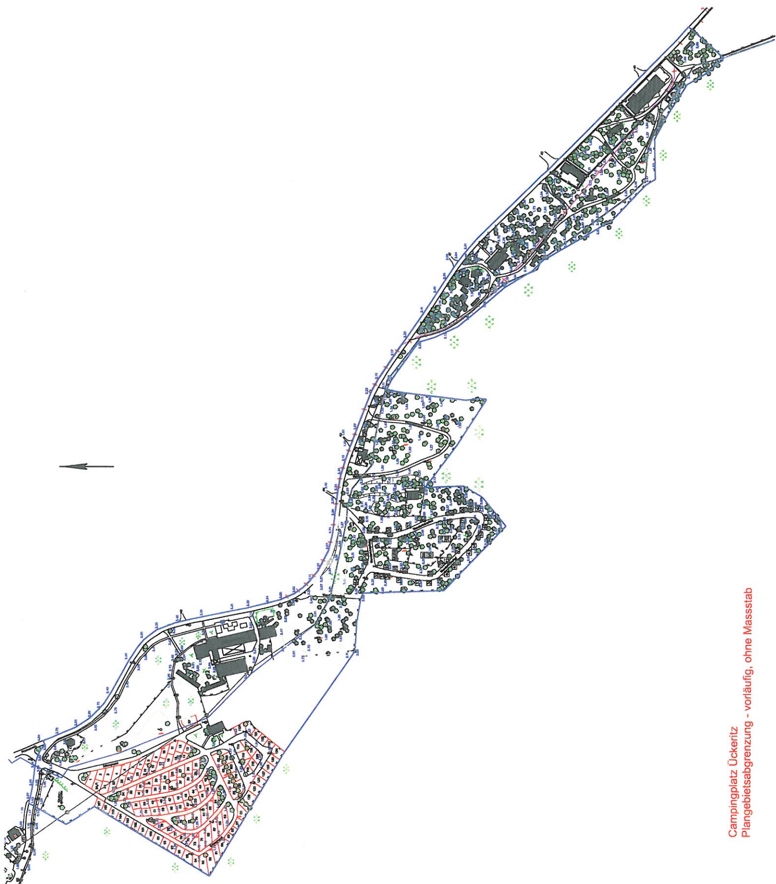
Campingplatz Ückeritz Plangebietsabgrenzung - vorläufig, ohne Masstab